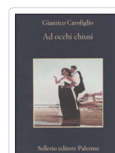
Ad occhi chiusi Carofiglio, Gianrico