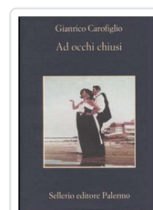
Ad occhi chiusi Carofiglio, Gianrico