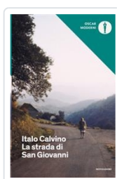
La strada di San Giovanni Calvino, Italo