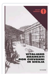
Don Giovanni in Sicilia Brancati, Vitaliano