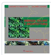
Energia solare e architettura Piemontese, Antonietta; Scarano, Rolando