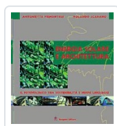
Energia solare e architettura Piemontese, Antonietta; Scarano, Rolando