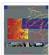
L'architettura del Mediterraneo Portoghesi, Paolo; Scarano, Rolando