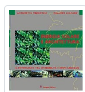
Energia solare e architettura Piemontese, Antonietta; Scarano, Rolando