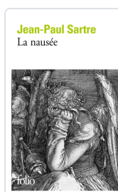
La Nausee Sartre, Jean Paul