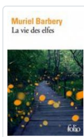
La vie des elfes Barbery, Muriel