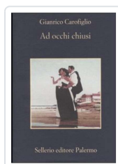
Ad occhi chiusi Carofiglio, Gianrico