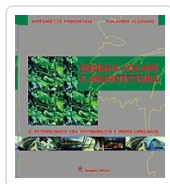
Energia solare e architettura Piemontese, Antonietta; Scarano, Rolando