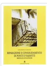
Riparazione e consolidamento di ponti e viadotti Lamanna, Luigi Franco