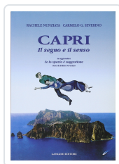
Capri - Il segno e il senso Nunziata, Rachele; Severino, Carmelo G.