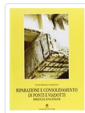
Riparazione e consolidamento di ponti e viadotti Lamanna, Luigi Franco