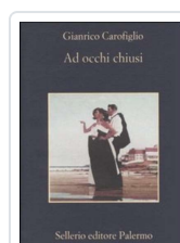
Ad occhi chiusi Carofiglio, Gianrico