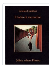
Il ladro di merendine Camilleri, Andrea