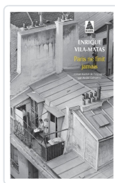
Paris ne finit jamais Vila-Matas, Enrique