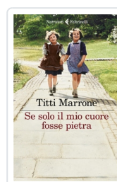
Se solo il mio cuore fosse pietra Marrone Titti