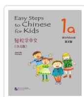
Easy steps to Chinese for Kids 1A - Workbook Ma, Yamin