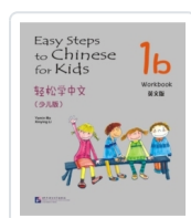
Easy Steps to Chinese for Kids 1B - Workbook Ma, Yamin