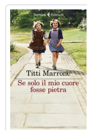
Se solo il mio cuore fosse pietra Marrone Titti