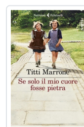
Se solo il mio cuore fosse pietra Marrone Titti