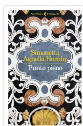
Punto pieno Agnello Hornby, Simonetta