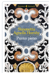
Punto pieno Agnello Hornby, Simonetta