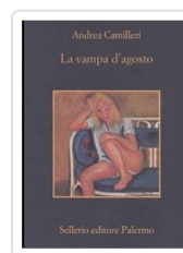
La vampa di agosto Camilleri, Andrea