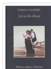
Ad occhi chiusi Carofiglio, Gianrico