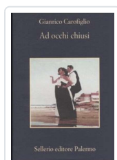
Ad occhi chiusi Carofiglio, Gianrico