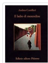
Il ladro di merendine Camilleri, Andrea