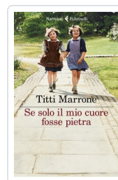
Se solo il mio cuore fosse pietra Marrone Titti