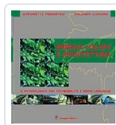
Energia solare e architettura Piemontese, Antonietta; Scarano, Rolando