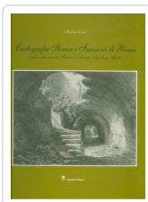
Cartografia storica e incisione di Roma Carta, Marina