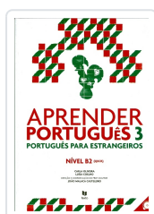
Aprender Português 3 (Manual+audio online) Oliveira, Carla