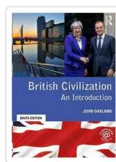
British Civilization 9ed rev. Oakland, John