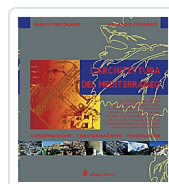
L'architettura del Mediterraneo Portoghesi, Paolo; Scarano, Rolando