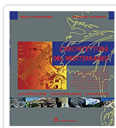
L'architettura del Mediterraneo Portoghesi, Paolo; Scarano, Rolando