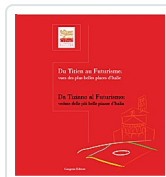
Da Tiziano al futurismo - Du Titien au futurisme Strinati, Claudio