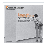
I Luoghi del Contemporaneo - Bilingue It-Ing) Mosca, Antonella