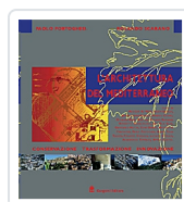
L'architettura del Mediterraneo Portoghesi, Paolo; Scarano, Rolando