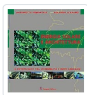
Energia solare e architettura Piemontese, Antonietta; Scarano, Rolando