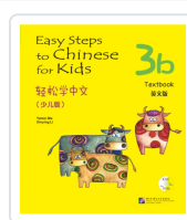
Easy Steps to Chinese for Kids 3B - Textbook - Incluye código QR Ma, Yamin