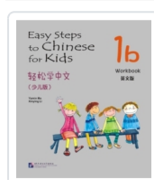
Easy Steps to Chinese for Kids 1B - Workbook Ma, Yamin