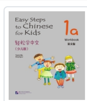
Easy steps to Chinese for Kids 1A - Workbook Ma, Yamin