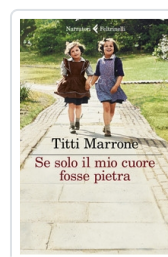
Se solo il mio cuore fosse pietra Marrone Titti