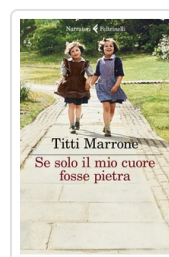
Se solo il mio cuore fosse pietra Marrone Titti