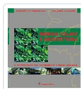
Energia solare e architettura Piemontese, Antonietta; Scarano, Rolando