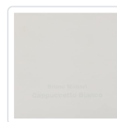
Cappuccetto Bianco Munari, Bruno