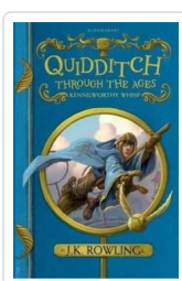
Quidditch Through the Ages Rowling, J.K.