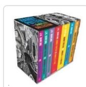
Harry Potter Boxed Set Ed. Adults Rowling, J.K.