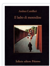
Il ladro di merendine Camilleri, Andrea