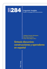
Sinaxis Discursiva: Construcciones Y Operadores En Español : 284 AA.VV.