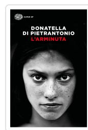
L'Arminuta Di Pietrantonio, Donatella