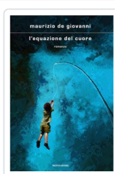
L'equazione del cuore De Giovanni, Maurizio