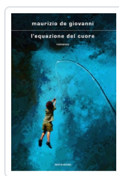
L'equazione del cuore De Giovanni, Maurizio