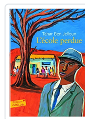
L'école perdue Jelloun, Tahar Ben