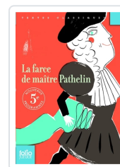
La farce de maître Pathelin Anónimo