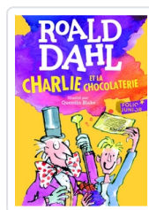
Charlie et la chocolaterie Dahl, Roald