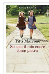
Se solo il mio cuore fosse pietra Marrone Titti