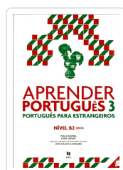
Aprender Português 3 (Manual+audio online) Oliveira, Carla