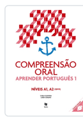
Aprender Português 1 (Comp Oral+audio online) A1-A2 Oliveira, Carlos de