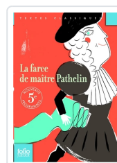
La farce de maître Pathelin Anónimo