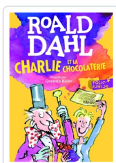
Charlie et la chocolaterie Dahl, Roald