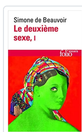
Le Deuxième Sexe, Tome 1 Beauvoir, Simone de