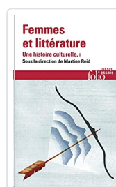
Femmes et littérature Vol. 1 Collectif