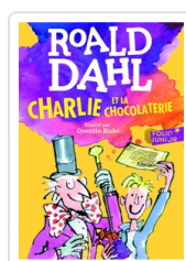
Charlie et la chocolaterie Dahl, Roald