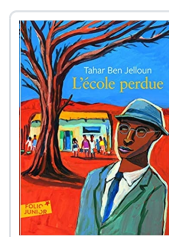
L'école perdue Jelloun, Tahar Ben