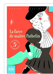
La farce de maître Pathelin Anónimo