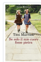
Se solo il mio cuore fosse pietra Marrone Titti