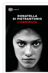
L'Arminuta Di Pietrantonio, Donatella