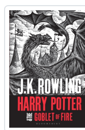
H P 4: the Goblet of Fire Rowling, J.K.