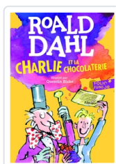
Charlie et la chocolaterie Dahl, Roald