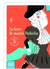
La farce de maître Pathelin Anónimo