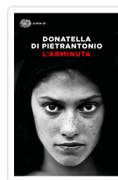
L'Arminuta Di Pietrantonio, Donatella