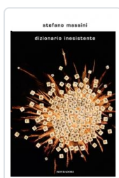
Dizionario inesistente Massini, Stefano