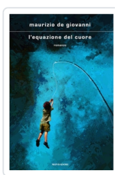
L'equazione del cuore De Giovanni, Maurizio